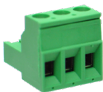
Bornes à vis (pincés montantes)